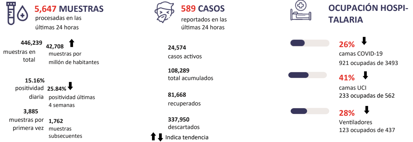
Figura 1. Tendencia de los casos y positividad de COVID-19 en República Dominicana al 19/09/2020