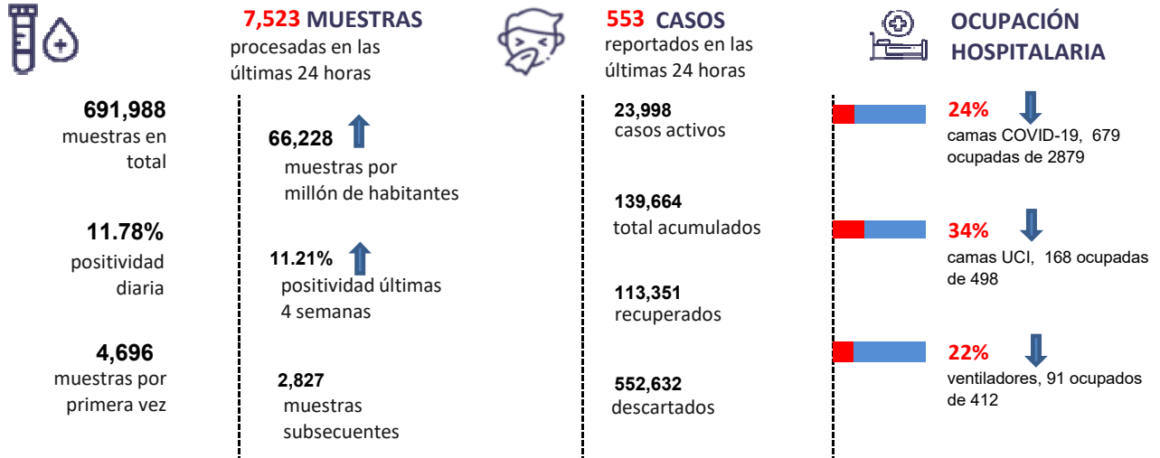
Figura 1. Tendencia de los casos y positividad de COVID-19 en República Dominicana