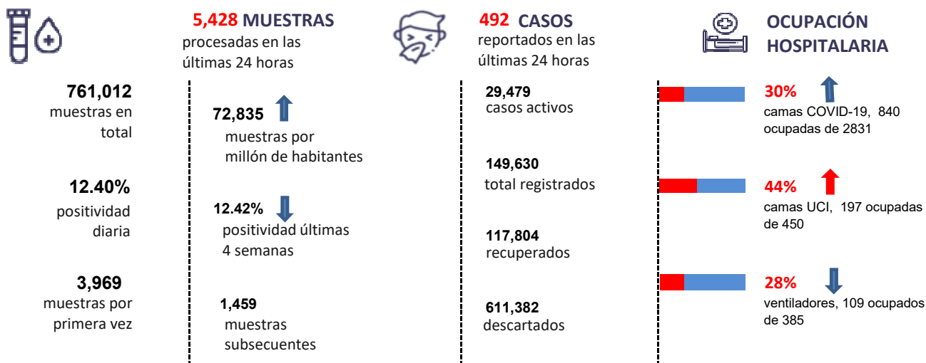
Figura 1. Tendencia de los casos y positividad de COVID-19 en República Dominicana