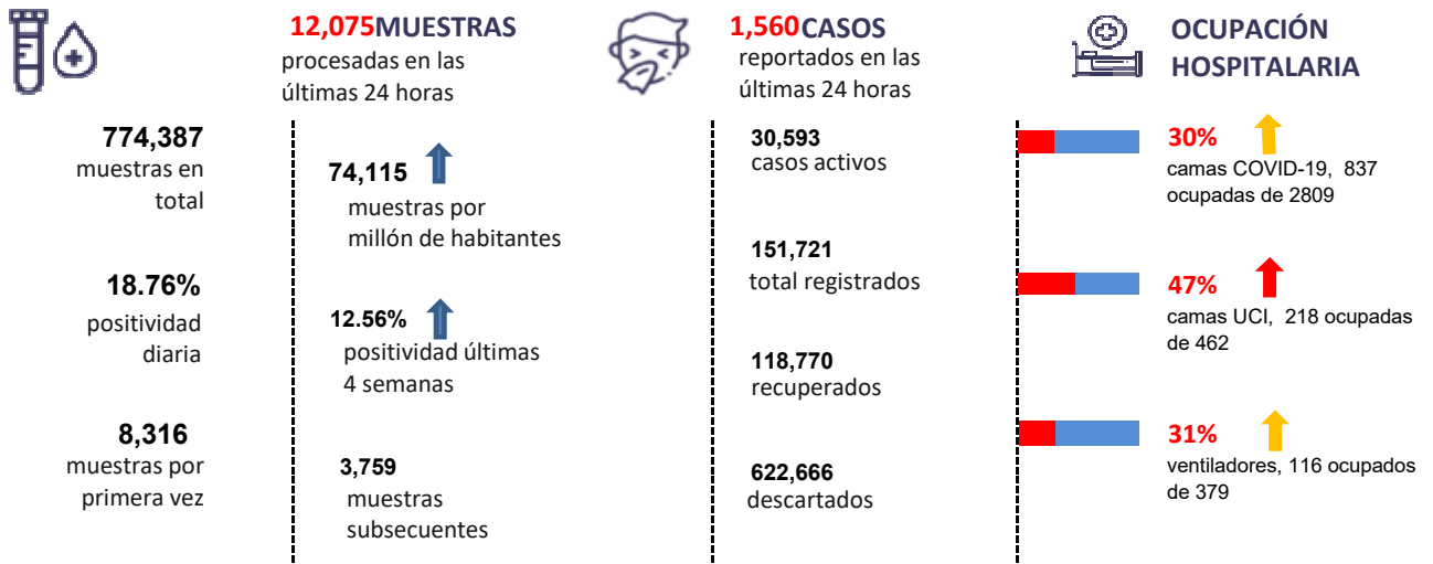
Figura 1. Tendencia de los casos y positividad de COVID-19 en República Dominicana