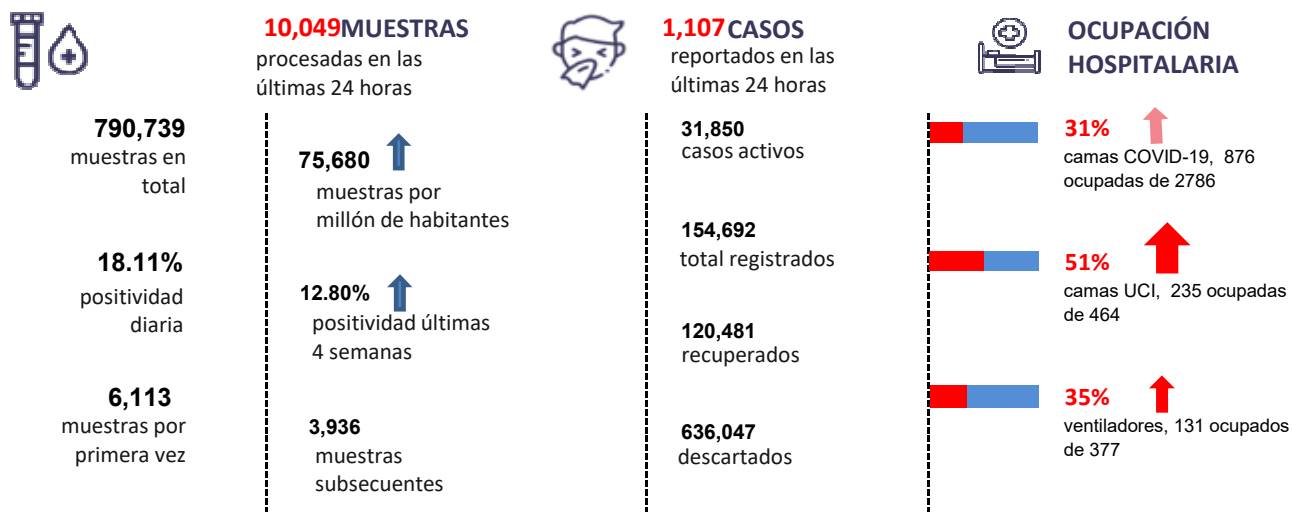
Figura 1. Tendencia de los casos y positividad de COVID-19 en República Dominicana