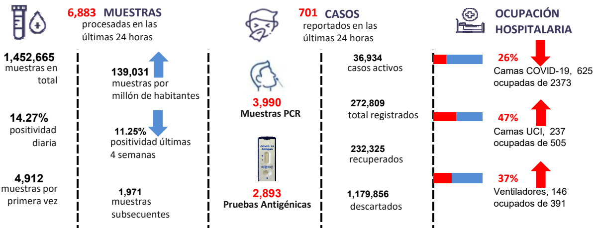
Figura 1. Tendencia de los casos v positividad de COVID-19 en República Dominicana